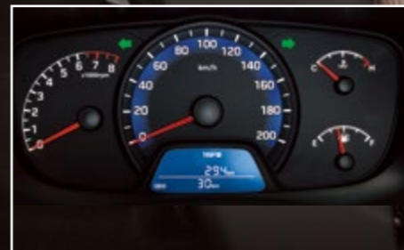
Bảng đồng hồ

Gương tự động điều chỉnh giúp chống chói khi đi ban đêm. Ngoài ra, gương còn được tích hợp màn hình hiển thị camera lùi.