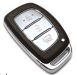
Chìa khóa thông minh

Với hệ thống ghế ngồi đáp ứng được cho 5 người lớn cùng khoang hàng lý tiện nghi rộng rãi, Grand i10 Sedan mang tới cho khách hàng một không gian tối ưu nhất. Ngoài ra, xe còn được trang bị rất nhiều ngăn để đồ tiện ích, đảm bảo khả năng sử dụng hiệu quả cho bất kì mục đích nào.