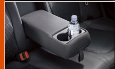
Tựa tay tích hợp khay để cốc

Tiện ích thường chỉ thấy ở các hạng xe cao cấp, giúp đem lại sự tiện nghi tối đa.