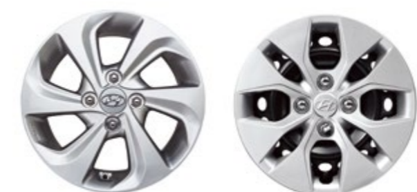
Vành đúc hợp kim 14"