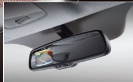
Gương chiếu hậu chống chói với camera lùi

Khởi động động cơ với chỉ một nút bấm trong khi vẫn để chìa khóa trong túi của bạn.