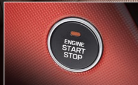
Nút bấm khởi động

Tiện ích thường chỉ thấy ở các hạng xe cao cấp, giúp đem lại sự tiện nghi tối đa.